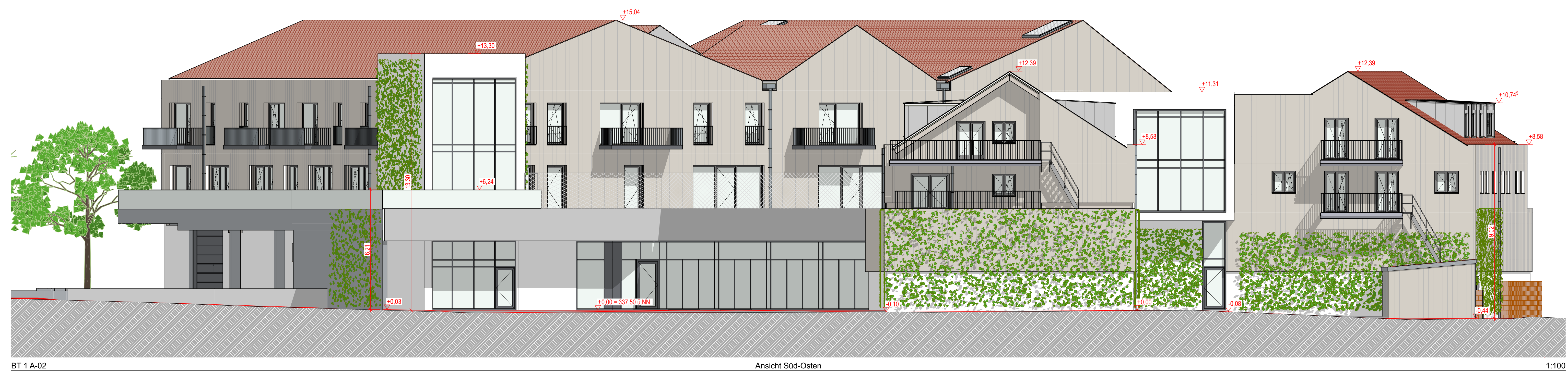
BT 1 A-02 Ansicht Süd-Osten 1:100