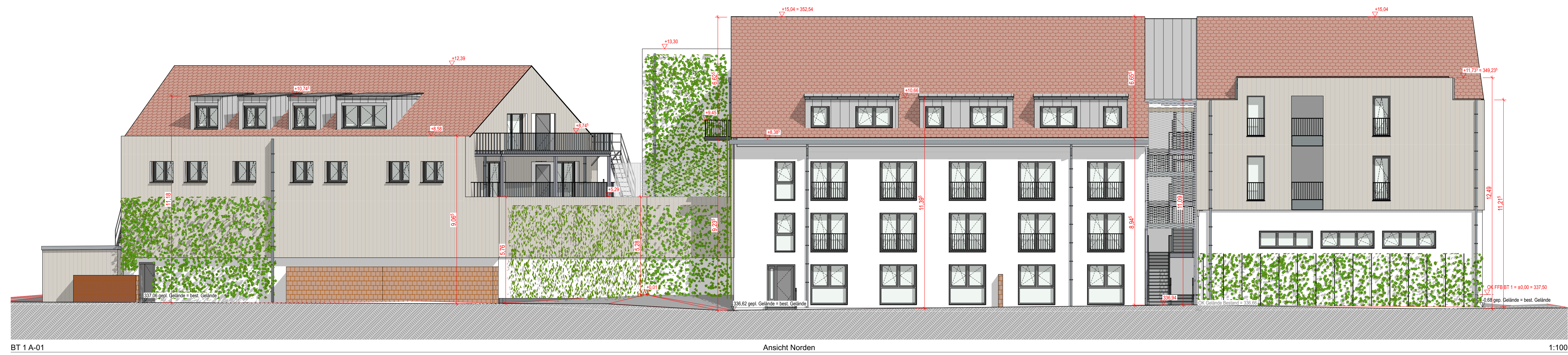
BT 1 A-01 Ansicht Norden 1:100