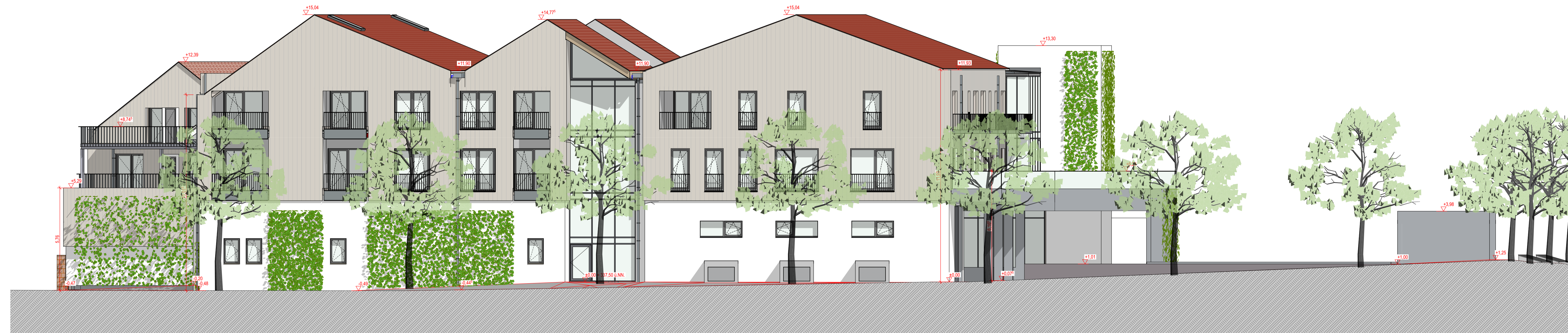
BT 1 A-04 Ansicht Nordwesten 1:100