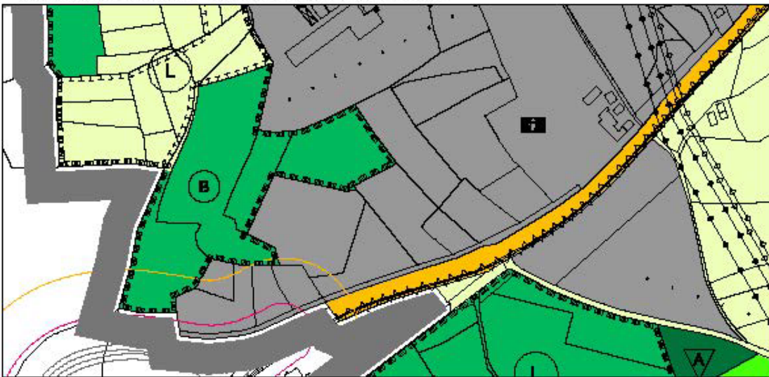
5. Teiländerung des FNP